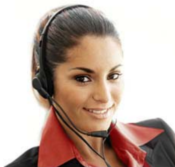
Exemple d'un appel mystère